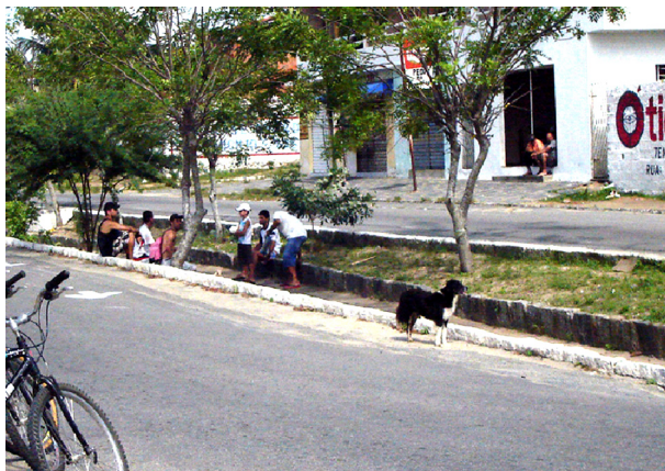
Imagem 03: Moradores sentados nas encostas do canal.